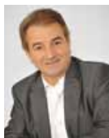
Jean-Michel LALÈRE, Maire de Fontenay-le-Comte

Ainsi notre belle cité se fera l'écho de récits où l'imaginaire et l'amour de la langue vivante nous révéleront que, parfois, la fiction est la voie qui mène au réel.