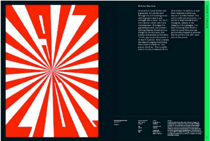
The World's Best Typography 39, 352 pages, 21 x 28 cm, TDC, New York, 2018.