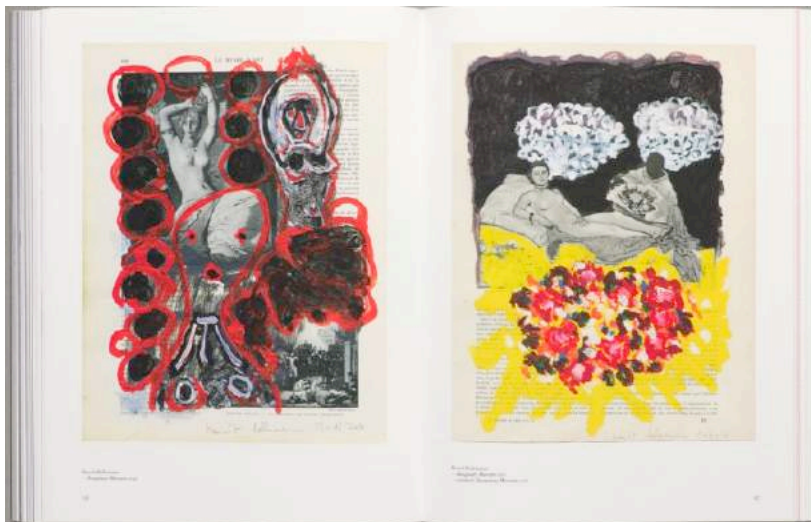
Pan & The Dream Magazine, 200 pages, 37 x 28 cm,