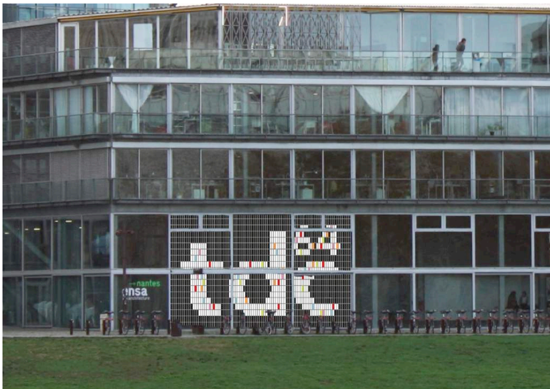
Charlotte Ricordel & Louise Bouisset, TDC 64 , 2019, pailles enfilées sur cordelettes tressées, dimensions variables. Étudiantes de l'ECV Nantes, lauréates d'un concours interne qui a fait suite à un workshop mené par Olivier Lafuente.