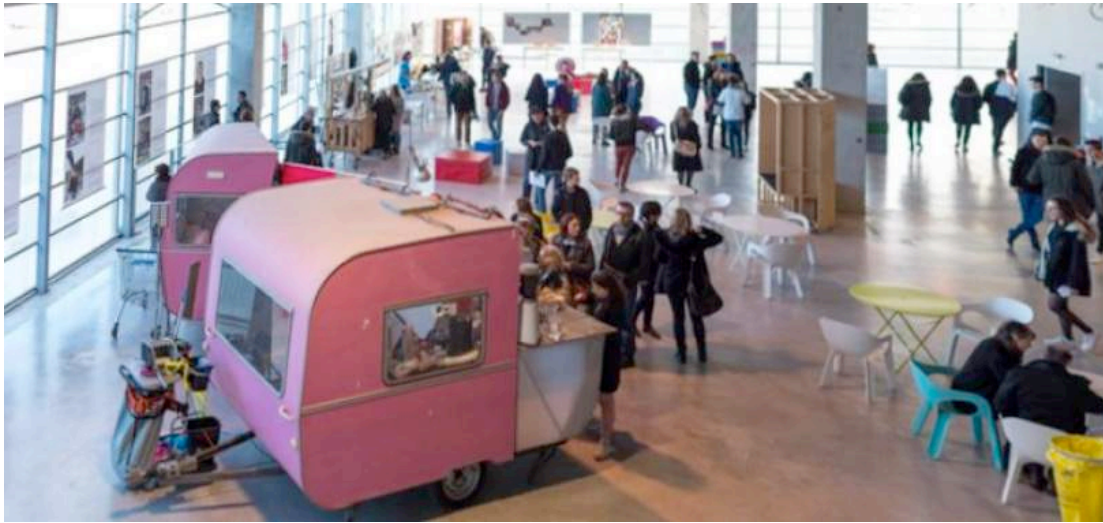
Vue des Journées portes ouvertes, ensa, Nantes, 2018.

En construisant une architecture de grande capacité, l'agence Lacaton & Vassal a inventé pour l'école nationale supérieure d'architecture de Nantes un dispositif capable de créer un ensemble de situations riches et diverses sur la ville et le paysage. Aux espaces du programme sont associés d'amples volumes en double hauteur dont fait partie la galerie Loire. À l'initiative des étudiants, professeurs ou des invités ces espaces deviennent le lieu d'appropriations, d'événements et de programmations possibles. Tel un outil pédagogique, le projet questionne le programme et les pratiques de l'école d'architecture autant que les normes, les technologies et son propre processus d'élaboration.